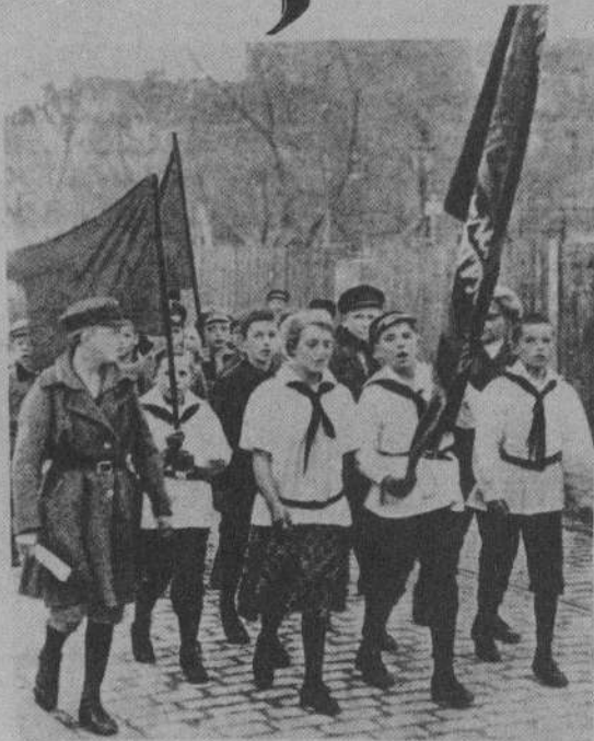
Jungspartakus in der Matfront des internationalen Proletariats

Politische Demonstration in den Reihen einer kommunistischen Jugendorganisation und romantisches Fahrtenleben in kleinen bürgerlichen Jugendbünden: das sind die Wurzeln deutscher Jugendbewegung vor und nach dem 1. Weltkrieg.